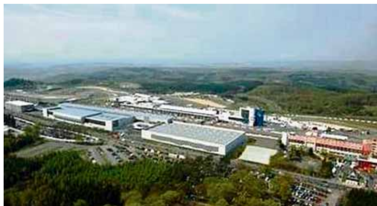
Vue sur les infrastructures d'accueil