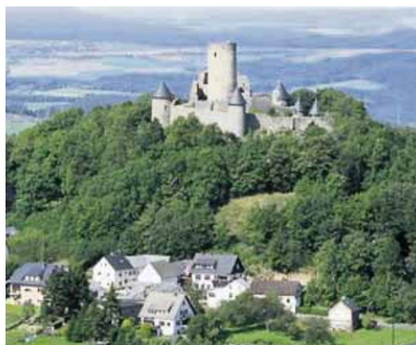
Le château de Nürburg